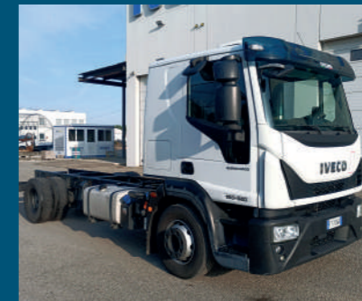
EUROCARGO € 28.500,00

MODELLO Daily 35C14N a telaio ANNO 2019 KILOMETRI 94.860