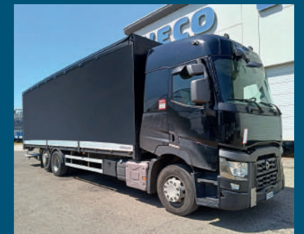
RENAULT € 44.000,00

MODELLO Man TGX 480 ANNO 2015 KILOMETRI 999.500