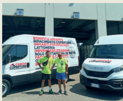
CANOVI COPERTURE SRL