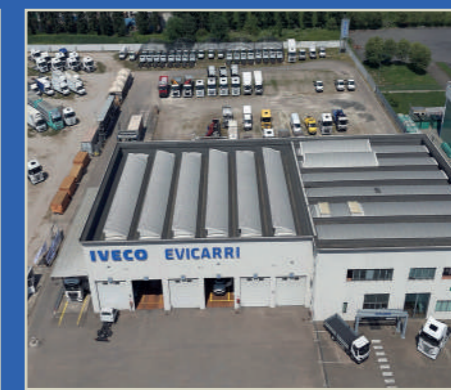
Evicarri - San Cesario (MO) Sede | Officina