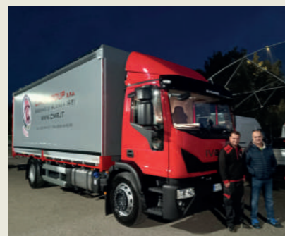
CMR GROUP SPA