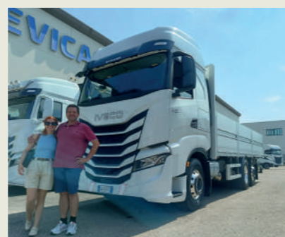
BASSI LOGISTICA SRL