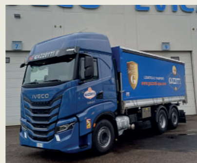
CASA DI SPEDIZIONE GAZZOTTI S.P.A