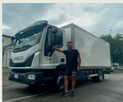
CANTINA GIROTTI SOC. AGRICOLA S.S.