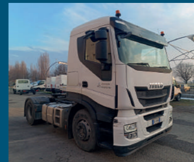
Trattore IVECO € 20.000,00

MODELLO DAF XF 530 ADR ANNO 2019 KILOMETRI 766.500