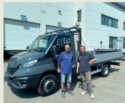
ARTISTICA EMILIANA SRL