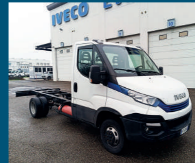
DAILY gas metano € 15.000,00

MODELLO Fiat Ducato Furgone ANNO 2019 KILOMETRI 223.860