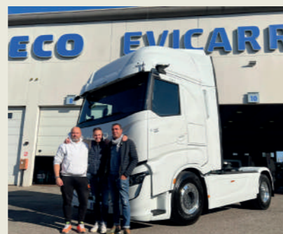
AUTOTRASPORTI F.LLI PAGLIA