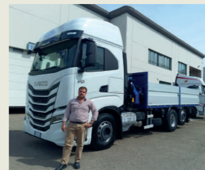
EMILIA TRASPORTI SRL