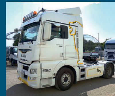
Trattore MAN € 13.500,00

MODELLO Stralis AS440S46T/P ANNO 2014 KILOMETRI 508.660