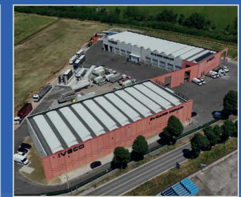
Evicarri - Sassuolo (MO) Sede | Officina | Magazzino Ricambi