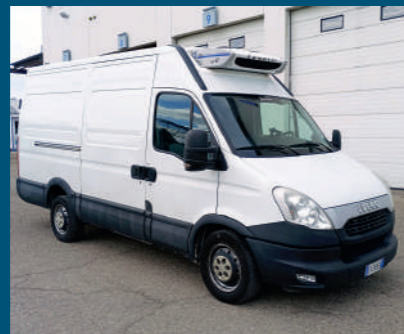
DAILY ATP € 10.500,00

MODELLO Iveco Daily 35S14 A8 ANNO 2018 KILOMETRI 201.000