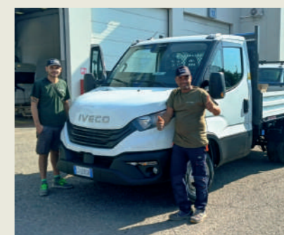
GRUPPO AMATO SOC. CONS. A.R.L.