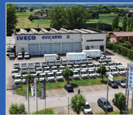
Evicarri - Bagno (RE) Sede | Officina