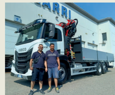
REGGIO PONTEGGI SRL