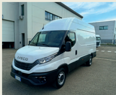
4 MADONNE CASEIFICIO DELL'EMILIA SOC. COOP. AGR.