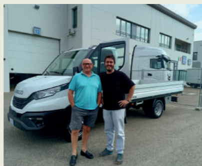
B & C SRL