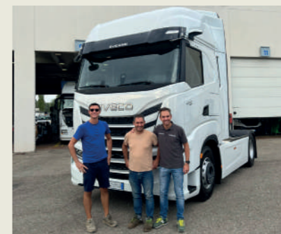
EURO 2008 S.R.L.