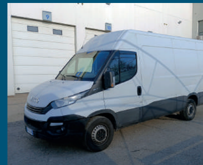
DAILY VAN € 14.500,00

| VERIFICA LA DISPONIBILITÀ DEI VEICOLI QUI RIPORTATI CON IL NOSTRO PERSONALE O SUL SITO CAMIONUSATO.NET