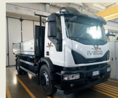
VALENTINI ITALO E FIGLI SNC