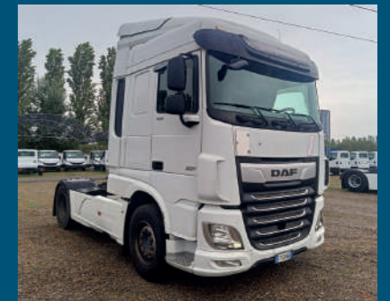
Trattore DAF € 25.000,00

MODELLO IVECO 160E32/FP a telaio ANNO 2019 KILOMETRI 575.000