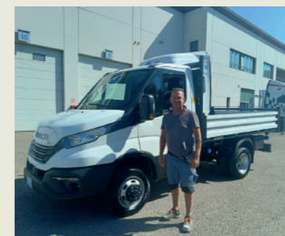
EDIL CORRADI SNC