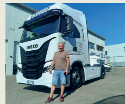
ROMEI STEFANO SAS