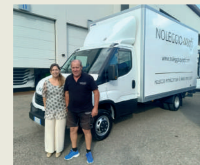
ESSE FOOD SRL