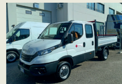
COGECA COSTRUZIONI SRL