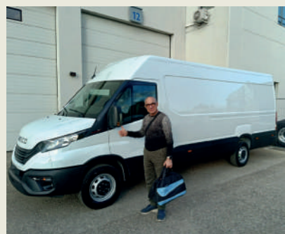
CARPI SERVICE SRL.