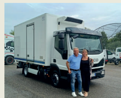
BORTOLI SERGIO SRL