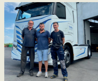
TRAVEL TRASPORTI SRL