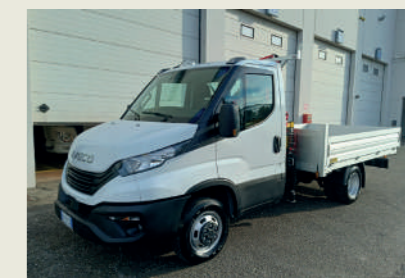
CONSORZIO DI BONIFICA DELL'EMILIA