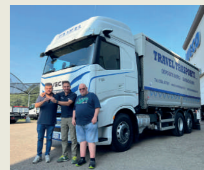
TRAVEL TRASPORTI SRL