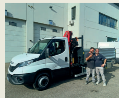
COSTRUZIONI FARAONE DI FARAONE TOMMASO