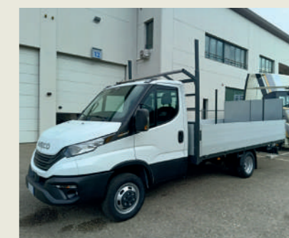
NUOVA VIMAPLAST SRL