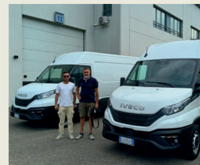
RESIN FLOOR SRL