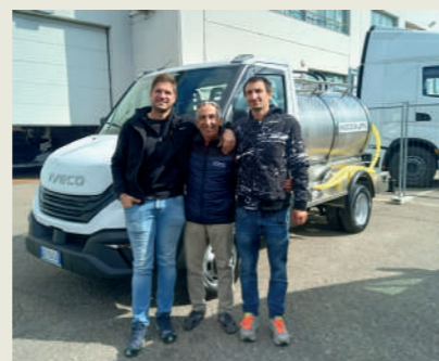
CASEIFICIO SOCIALE MINOZZO SCRL