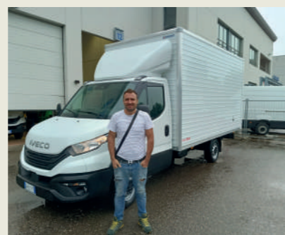
CARPI SERVICE SRL