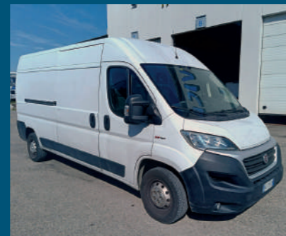
DUCATO € 13.000,00

MODELLO Iveco Daily 35S15V cella ATP ANNO 2014 KILOMETRI 321.000