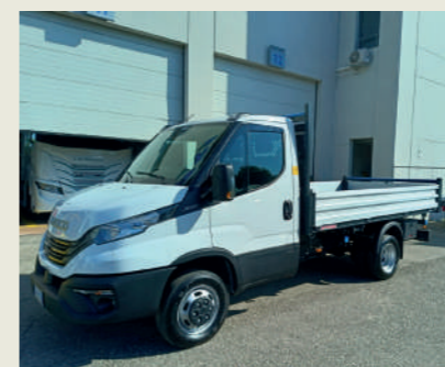
ESSEFFE BUILDING SRL